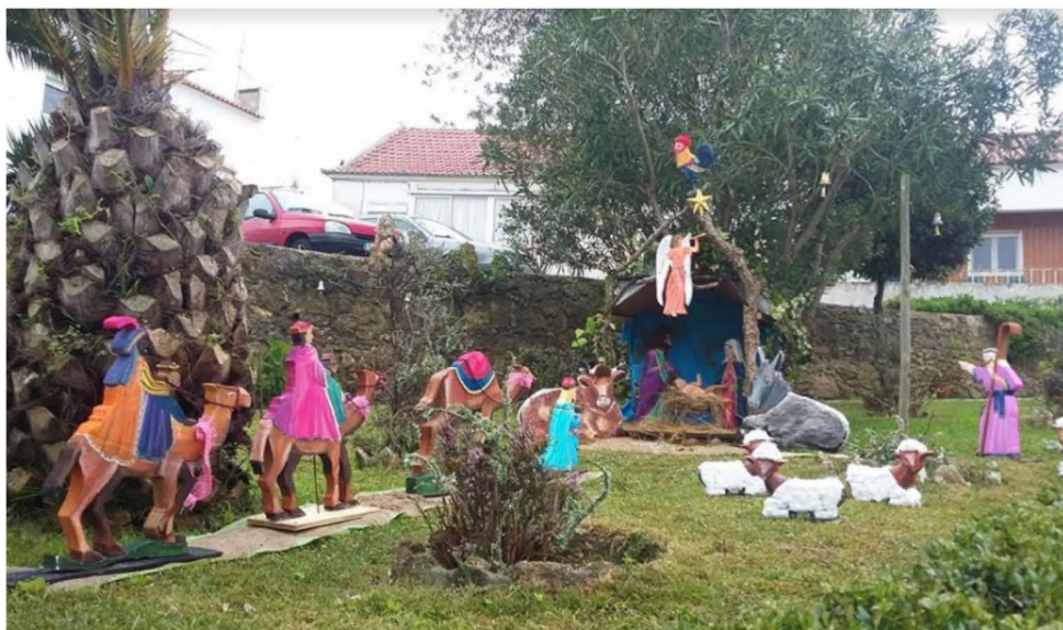
Foto do Presépio construído na Fonte Boa da Brincosa