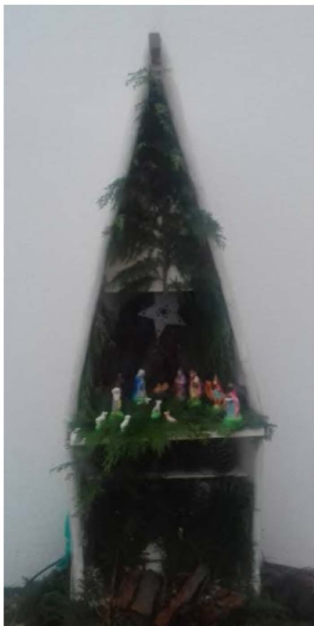
Foto do Presépio construído na Carvoeira

Este ano e respondendo ao desafio da Junta de Freguesia da Carvoeira foram 3 os presépios construídos e montados por voluntários da freguesia.