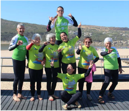
Foto de alguns dos participantes que aderiram a esta experiência mais radical

Foi uma aula de paddle que os idosos puderam experimentar, um desporto que pensavam ser apenas para os mais jovens.