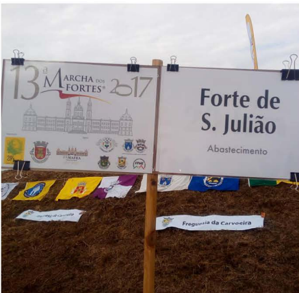
Foto de um dos postos de abastecimentos montado no Forte de São Julião