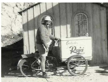
Um vendedor de gelados na praia da Foz do Lizandro.

Aqui deixamos alguns registos que vamos encontrando de locais, acontecimento ou até simplesmente