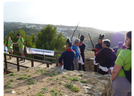
Recriação histórica com personagens do tempo das invasões francesas

A Junta da Carvoeira esteve presente e apoiou estas etapas com o fornecimento de fruta e bolos.