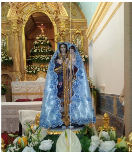
Imagem de Nossa Senhora da Nazaré já na nossa freguesia

Conforme é habitual apresentámo-nos ainda mais algumas vezes e atuámos também na Festa da Nossa Senhora da Nazaré.