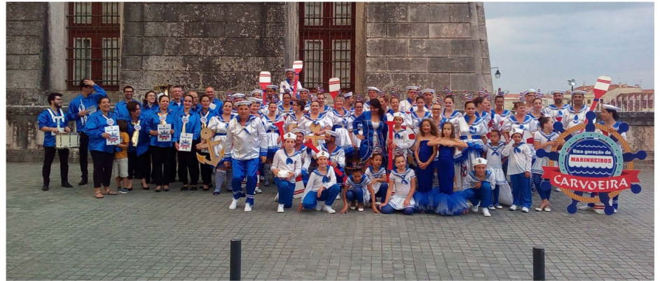
Foto de todo o grupo participantes na Marcha da Carvoeira em 2017

Com a participação de vários pares da freguesia, foi ao longo de vários meses que decorreram os ensaios e no dia 17 de junho apresentámos a nossa marcha no evento realizado em frente do Convento Mafrá!